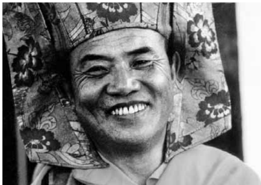
Der 16. Gyalwa Karmapa Rangjung Rigpe Dorje

Unser Angebot richtet sich an Menschen, die mit Beruf, Familie etc. mitten im Leben stehen und die mit den Möglichkeiten ihres Geistes arbeiten wollen. Wer sich nach einem ersten Kontakt weiter für den Diamantweg interessiert, besucht am besten regelmässig den wöchentlichen Dharma-Abend, um mit der buddhistischen Sichtweise, Philosophie und Meditation immer vertrauter zu werden.